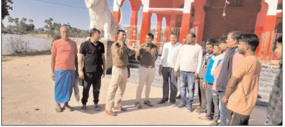
राष्ट्र संवाद संवाददाता

गोड़ा: पुलिस निरीक्षक व थाना प्रभारी ने लिया मदिरों की सुरक्षा व्यवस्था का जायजा,ग्रामीणों को दिए निर्देश