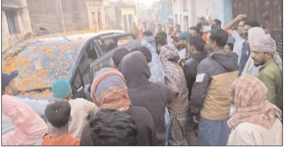
राष्ट्र संवाद संवाददाता

संक्षिप्त खबरें पीर साहब पहुंचे बिक्रमपुर, लोगों ने किया फुल बरसाकर स्वागत