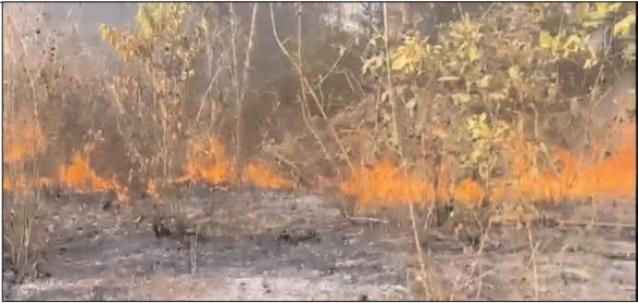
भी खतरे में पड़ गई है। चाकुलिया और घाटशिला के

लाखों रुपये की संपत्ति जलकर खाक हो गई। आग पर काबू पाने के लिए वन विभाग और स्थानीय प्रशासन लगातार प्रयास कर रहे हैं, लेकिन तेज गर्मी और शुष्क मौसम के कारण आग बुझाना एक बड़ी चुनौती बन गया है। जंगलों में लगी आग से न केवल वन संपदा को नुकसान हो रहा है, बल्कि यहाँ रहने वाले वन्यजीवों की ज़िंदगी