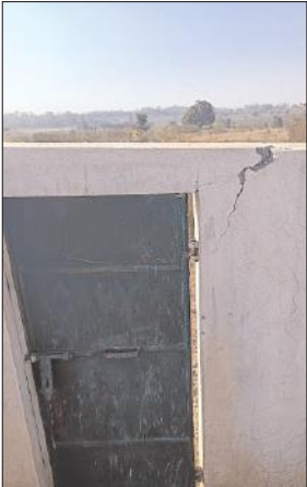
अभियंता शिकायत के बावजूद कोई पहल नहीं करते है सबसे

चाहे स्टेडियम का निर्माण का मामला हो या फिर अन्य योजनाओं की अब तो विभाग के कार्यपालक अभियंता के खिलाफ रिट याचिका दायर करने की बात भी कही है क्योंकि विभाग के कार्यपालक अभियंता या सहायक