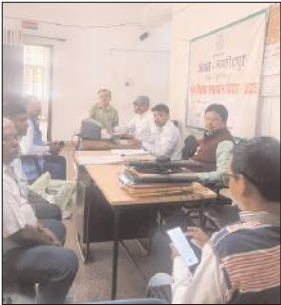
दौरान भूमि सीमांकन, नार्मांतरण,

के मौके पर संबंधित अंचल अधिकारी तथा थाना प्रभारी की मौजूदगी में डुमरिया थाना, कोवाली थाना, जादूगोड़ा थाना, धालभूमगढ़ थाना, गुड़ाबांदा थाना, बहरागोड़ा थाना, श्यामसुंदरपुर थाना, बोडाम थाना, घाटशिला थाना, कमलपुर थाना और पटमदा थाना, परसुडीह थाना और एमजीएम थाना परिसर में शिविर का आयोजन किया गया। इस